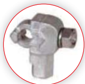
Zacisk strony wysokiego napięcia