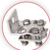
Wzmocniona stal do połączenia przewodów aluminiowych