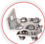
Wzmocniona stal do połączenia przewodów aluminiowych