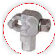
Zacisk strony wysokiego napięcia